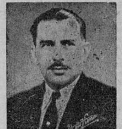
LIC. DON TEODORO PICADO

EL SECRETARIO DE NUESTRO PARTIDO c. MANUEL MORA, DIRIGE UNA CARTA AL PRESIDENTE DE LA REPUBLICA EN NOMBRE DEL BURO POLITICO